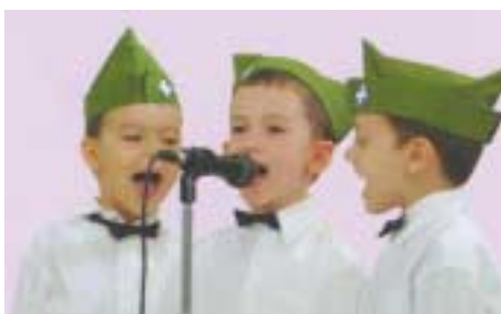
Οι μελλοντικοί μας απόφοιτοι. Η ελπίδα του Σ.Α.Φ.Ε.

τήσεις τους, να τους οδηγήσουμε σε διεξόδους, να τους προσφέρουμε όραμα και ανάσες ελπίδας. Στο σημείο αυτό, ο Σύνδεσμος Αποφοίτων Φιλεκπαιδευτικής Εταιρίας μπορεί να παίξει σημαντικό ρόλο και να συμβάλλει τα μέγιστα αξιοποι-